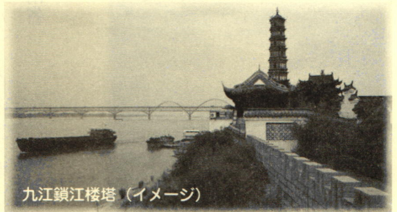
九江鎖江樓塔（イメージ）