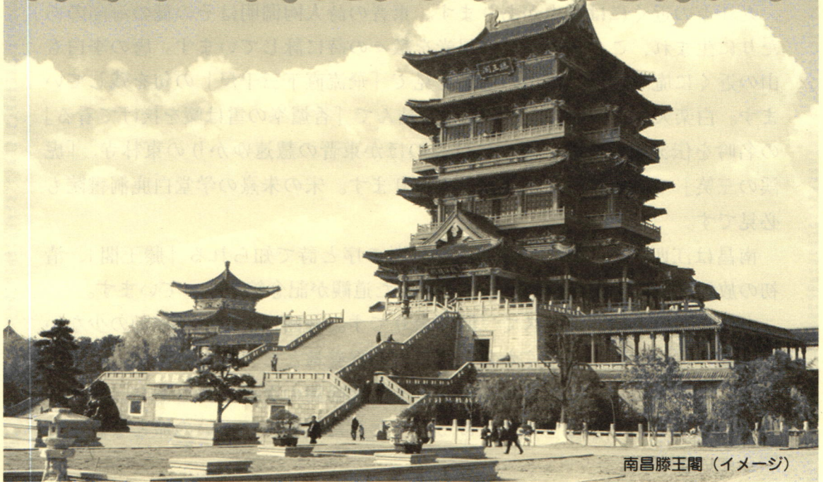
南昌滕王閣（イメージ）